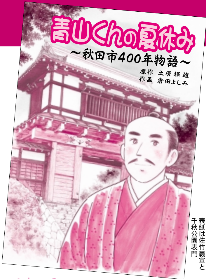
表紙は佐竹義宣と 千秋公園表門