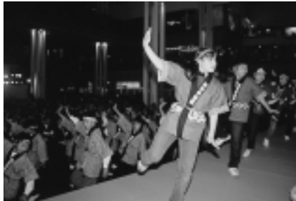
息もぴったり「新秋田音頭」

一月十一日、秋田市、河辺町、雄和町が合併し、新しい秋田市が誕生しました。新県都として、さらなる飛躍が期待される大きな大きな、はじめの一歩です！