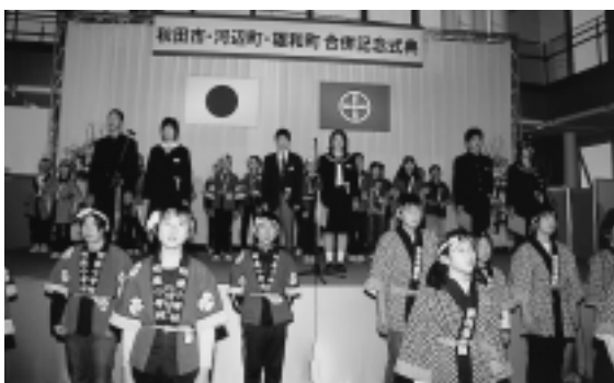
心をつなげて歌った秋田市記念市民歌

式典では、小学生によるアトラクション「新秋田音頭」が会場を盛り上げました。また、中学生たちが新生秋田市に夢を託した「未来への宣言」を力強く読み上げ、参列した市民の心を一つにつなぎました。