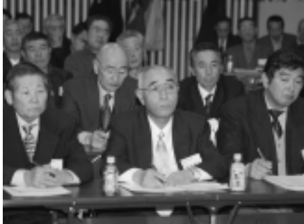
雄和地域での報告会