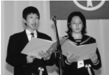
願いを込めた「未来への宣言」