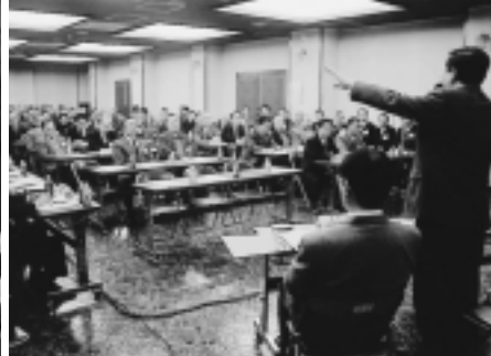
河辺地域での報告会