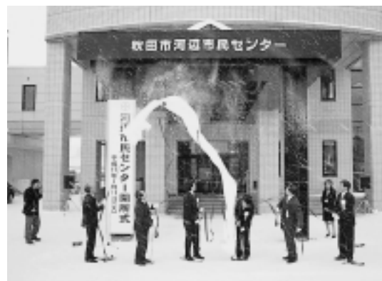
河辺市民センターの開所式