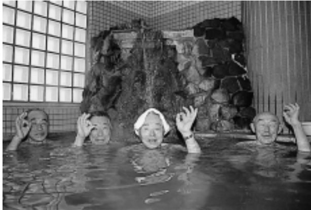
裸の付き合いで会話も弾みます