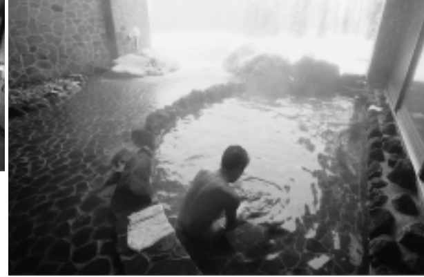
やっぱり露天風呂にかぎるね～