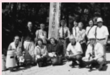
千秋公園での研修