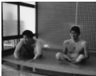
打たせ湯で心地よい快感

冷え性や神経痛のほか、アトピーにも効果があると評判！ 貸切で利用できる家族風呂も人気。宿泊できるコテージもあります。