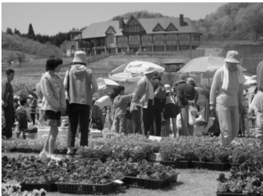
花いっぱいの雄和華の里スプリングフェア。今年も4月下旬から開催します。ぜひおいでください！

河辺・雄和地域の上下水道や農業関連施設などを引き続き整備します。また、地域活性化をはかるため、独自のイベントや伝統文化などを支援します。