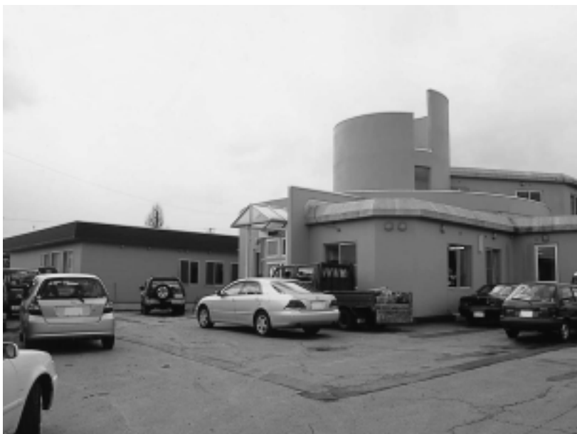
楯山地区コミュニティセンターを一部改築しました。新たに会議室、和室などが完成。どうぞご利用ください。

市民協働や男女共生をふまえたまちづくりを進めます。 保戸野地区には「市民協働型」のコミュニティセンターが開館します。