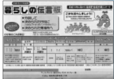
3月中旬に河辺・雄和地区に全戸配布した「暮らしの伝言板」も見てね！

ごみの収集日程について... 環境業務課 TEL(863)66331 河辺市民センター TEL(882)5132 雄和市民センター TEL(886)5520 ごみの分別について... 廃棄物対策課 TEL(866)2943