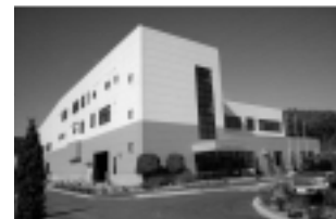
リサイクルプラザ

秋田市リサイクルプラザ内 TEL(829)3568 市総合振興公社の事務局。空きびん、空き缶などの収集処理業務を行っている環境保全公社の業務を引き継ぎます。