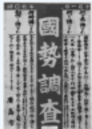
第1回国勢調査のポスター

今年の10月1日に、21世紀最初の国勢調査が実施されます。日本で最初に国勢調査が実施されたのは、今から85年前の大正9年。以後、ほぼ5年ごとに行われ、今回が18回目になります。