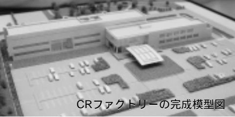
CRファクトリーの完成模型図

操業開始は来年五月。日本興亜損保では、今年八月から幹部候補から順に採用を始め、操業時まで、従業員