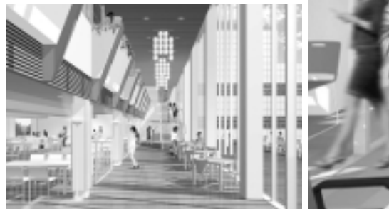
カフェテリアのイメージ図

多くの従業員を必要とするコールセンターの設置は、即効性のある雇用効果とあわせて、従業員の給料を支払う資金が県外から調達されることなどから、地域経済へ大きな波及効果が期待できます。また、従業員が顧客サービスの技術を習得するなど、優れた人材が育成されるといふメリットも生まれます。 秋田市では、日本興亜損保に対し、西部工業団地の用地貸付を行うほか、コールセンター