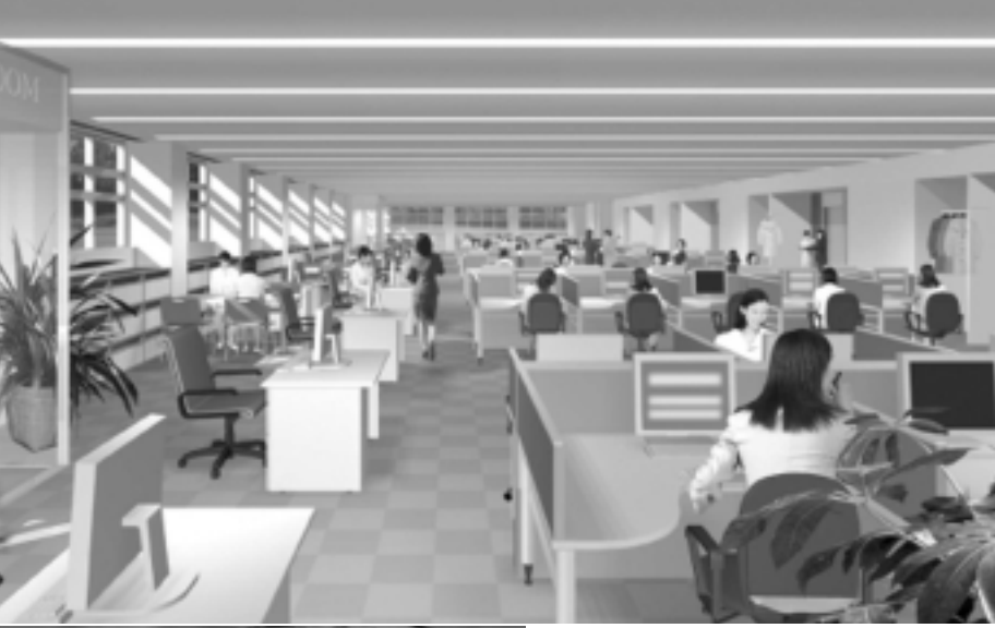
オフィスのイメージ図

日本興亜損害保険株式会社のコールセンター「CRファクトリー」の建設が新屋の西部工業団地で始まりまし。操業開始は来年五月で、採用は今年八月から開始。将来的に千二百人の雇用が見込まれます。