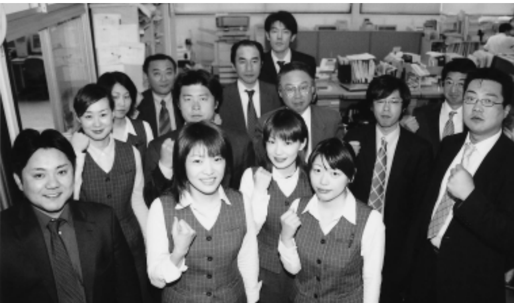
みんないっしょに、“私らしく”がんばります！ ...秋田活版印刷(株)のみなさん

家庭、学校、職場、地域のあらゆる場面で、男女が性別に関わりなくひとりの人間として、その個性と能力を発揮できるのが「男女共同参画社会」です。私たちのまわりの「パートナーシップ」について、この機会に改めて考えてみませんか？