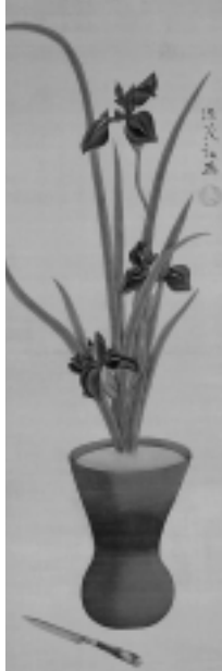
佐竹曙山「燕子花にナイフ図」

6月26日(日)、午前9時30分～午 後1時～の2回、旭川を下ります。 は秋田工業高校裏から大町三丁目まで、 は大町三丁目からサティの裏まで。 参加費2,000円。先着各20人。 申し込み NPO法人秋田パドラー ズ事務局tel(863)1166