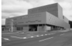
総合環境センター