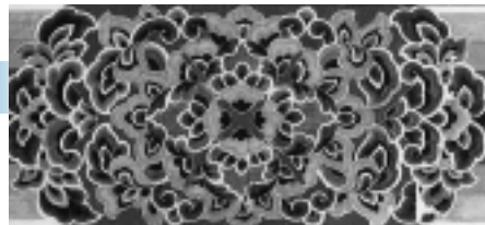
「平等院鳳凰堂 内陣内法長押側面」復元模写図