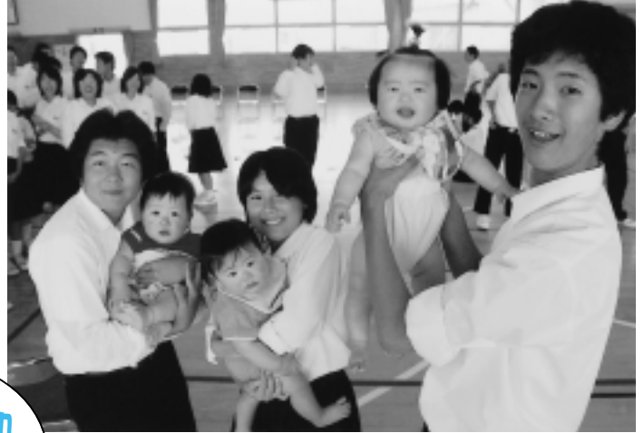
みんな笑顔でハイチーズ!