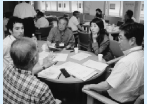
地域への思いなどを語り合いました

七月二十六日、西部地域( )に建設予定の「(仮称)市民サービスセンター」に関するワークショップ(話し合いの場)を、アトリエももさで開きました。