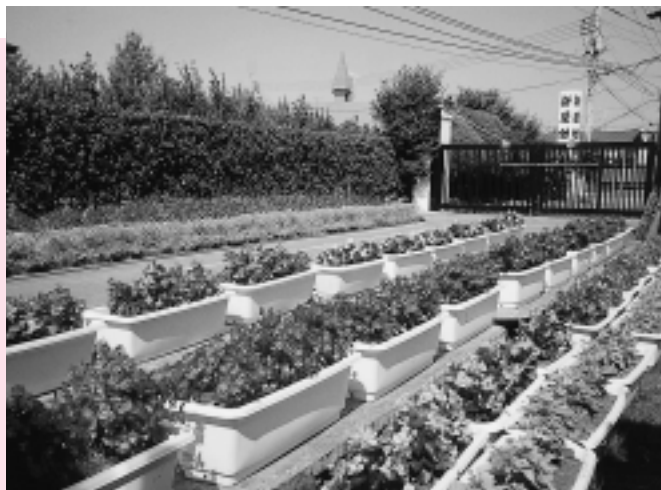
学校花だん特別優秀賞の新屋幼稚園の花だん