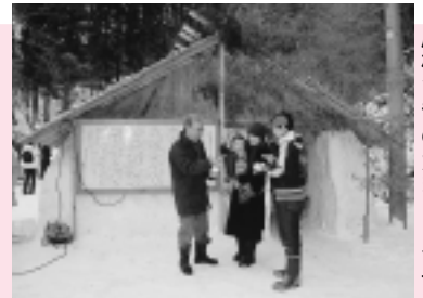
屋根つきのかまくらです