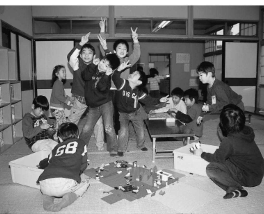
笑い声が響きます！ 川尻児童館で

川尻地区コミュニティセンターと川尻児童センターの複合施設を建設...現在、川尻児童館がある場所に建設します。和室、調理室、多目的ホール、児童センタースペースなど。今年度中の完成をめざします 予算▶ 4億806万円