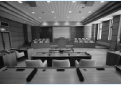
旧議場(上が河辺、下が雄和)