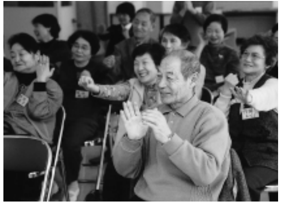
いつまでも健康でいきいき！ふれあい元気教室で