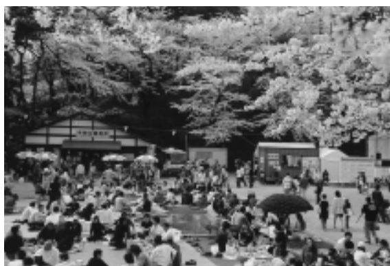
千秋公園の桜まつりは今年も30万人以上の花見客でにぎわいました

シーズン中、私のところへ県外から二組のお客さまがありました。プライベートのお客さままで三十代半ば