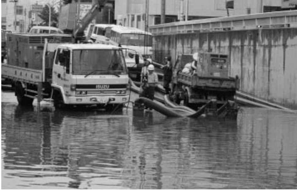
災害による避難勧告などをお知らせします(昭和62年、明田地下道)