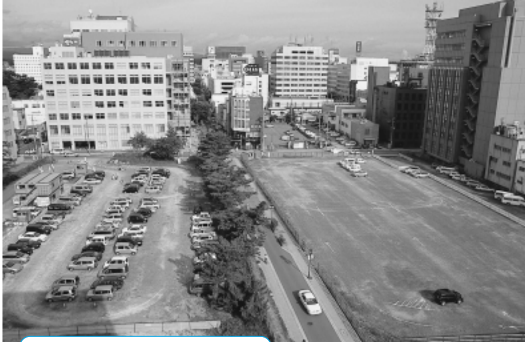
再開発の計画が進む日赤跡地(写真右部分)と婦人会館跡地。現在は、県が無料駐車場として開放しています