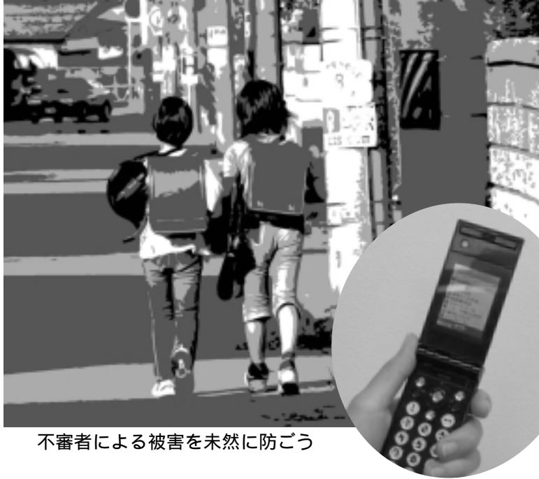
不審者による被害を未然に防ごう