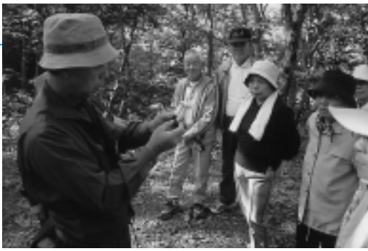
正しい知識を持ちましょう(河辺せせらぎ塾)