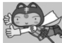
結核と闘う「シール坊や」

結核は、せき、くしゃみのしぶきでうつり、初期症状はかぜにそっくりです。2週間以上せきが続くなど、体に異変を感じたら早めの受診を！ 健康管理課tel(883)1180