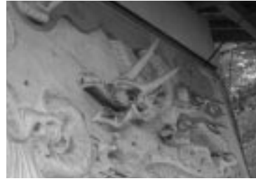
下北手・鈴木家の土蔵

コース 土蔵や壁に描かれた鏝絵を見学 市役所分館 太平・下北手地区の鏝絵を見学 国重要文化財・旧黒澤家住宅 市役所分館