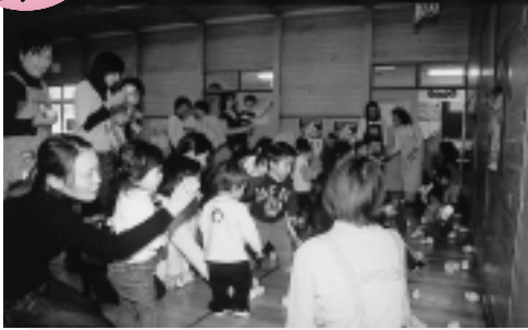
壁に貼った鬼の絵に、「鬼は〜外！」