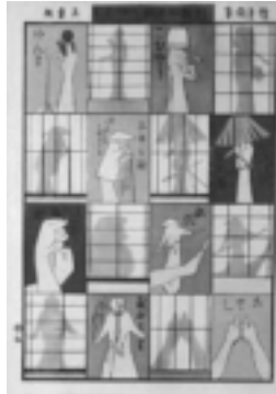
「新板上げぼしづくし」