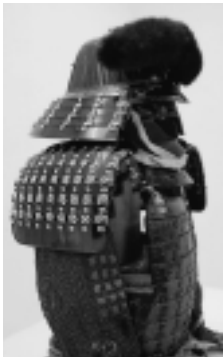
「初代藩主義宣所用 伊予札黒韋素懸威二枚胸具足」