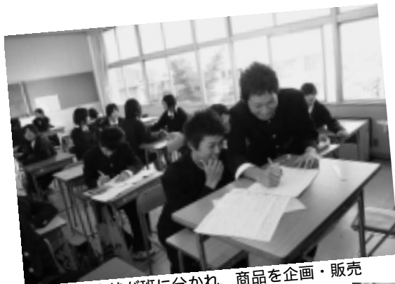
全校生徒が班に分かれ、商品を企画・販売