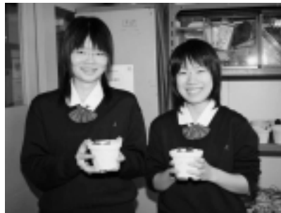
上 / 古新聞を利用したフラワーポット 左 / 会場のアルヴェを飾る「AKISHOP」の文字を作成中