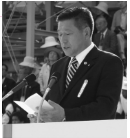
国体開会式で歓迎のあいさつ