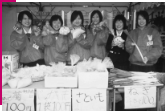
昨年のアキショップ