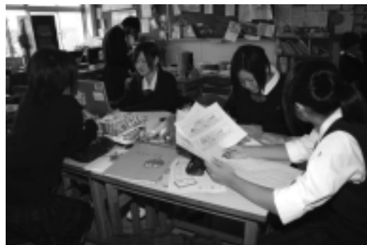
生徒たちのアイデアがいっぱい