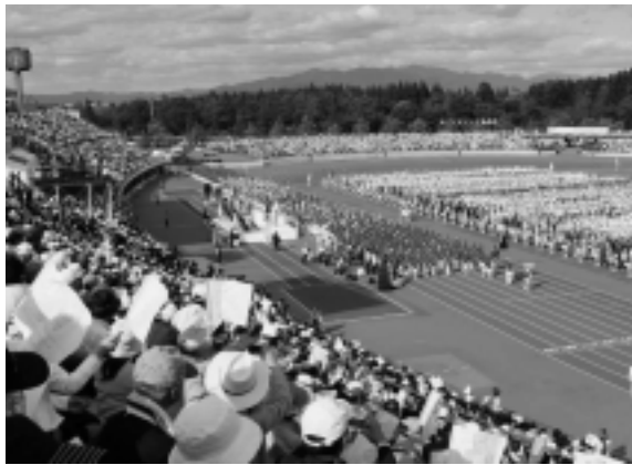
選手団入場、あふれる感動の瞬間でした

障害者スポーツ大会もすばらしいものでした。初めて目にする種目を観戦し、「ハンディを乗り越えて」と