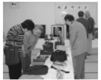
11月18日、市の駅東第三地区会議室で、城東町内会のミニ文化祭が開催されました。町内のみなさんの力作97点に、来場者は「たいしたもんだ」と感心。