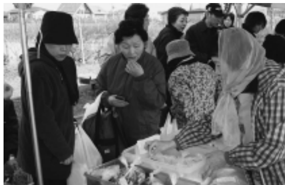
農家のかたの手作りの漬け物は絶品