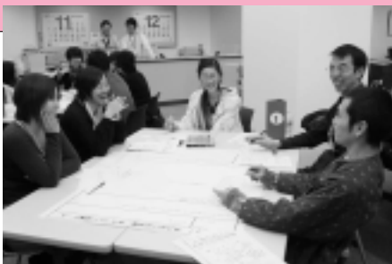
それぞれ理想のまちを提案し、その実現を考えました