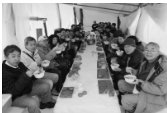
雪のテーブルで手作りうどん。いただきます～す！ (2月29日、まんたらめ ながみの森)