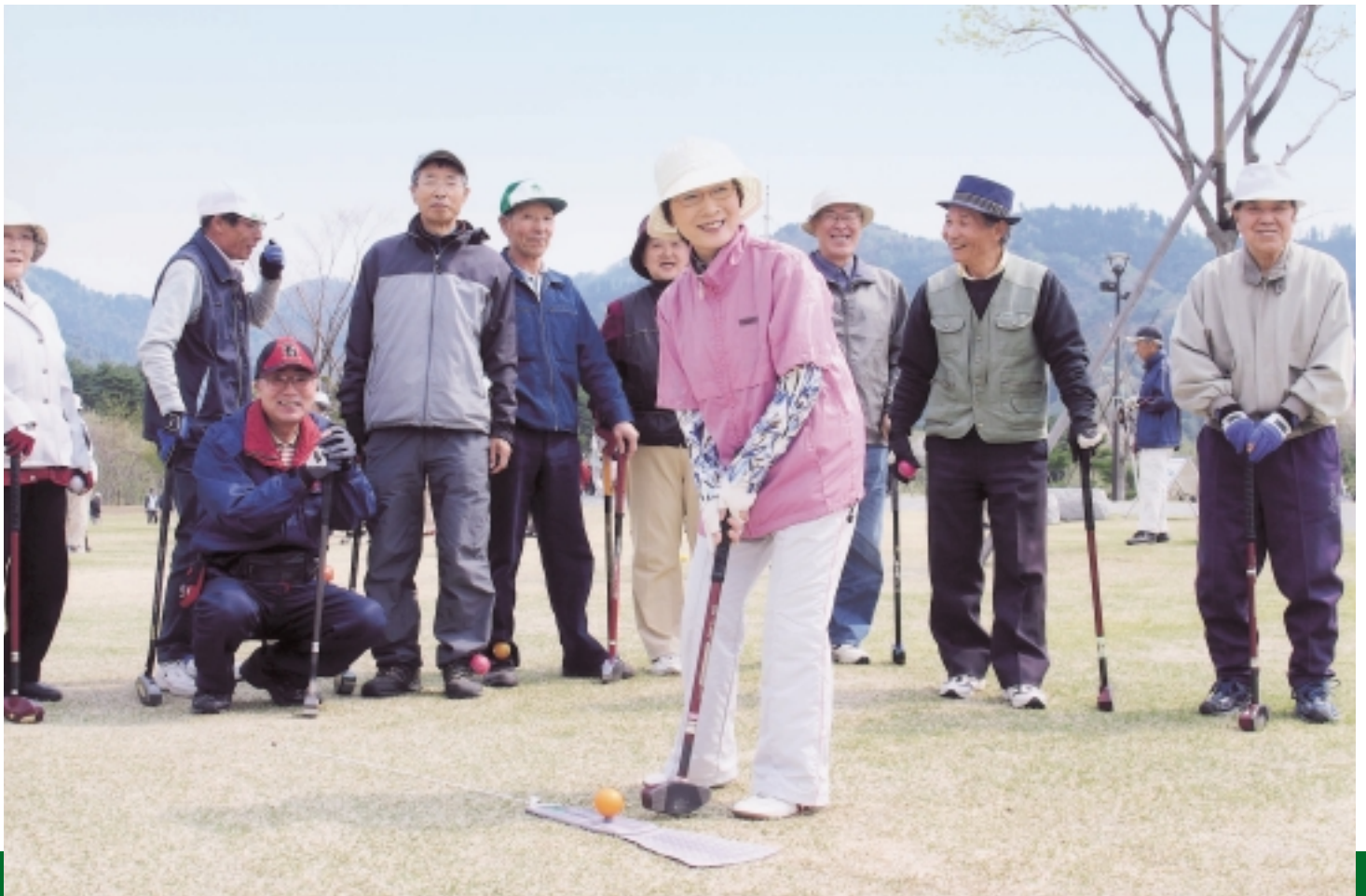
仲間といきいき、スマイルショット！(4月29日、秋田市グラウンド・ゴルフ交流大会)