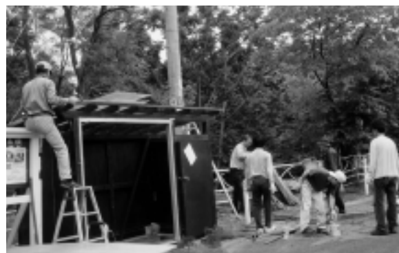
班員など12人が集まって、一気に仕上げました