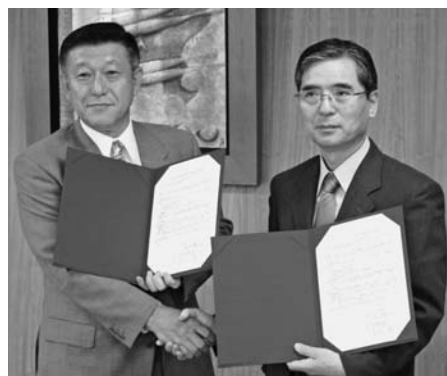
秋田大学との連携協定調印式で(7月11日)