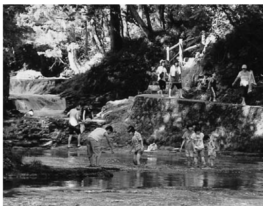
夏ならではの遊びを楽しもう!(河辺・伏伸の滝)

半分おぼれかけ、川の水にむせながらも、年長者のリードで自然に泳ぎを覚えたものです。また、子ども