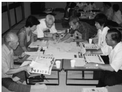
東部地域の景観ミーティングの様子

この景観マップは、市の景観計画策定の一環として都市計画課が案を作成。昨年の8月から10月までに、東部・西