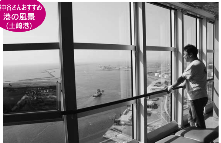
セリオンから見る夕日は最高！

小さいころから港の夕日を見て育ちました。学校が終わるとランドセルを置いてそのまま釣りに行ったり…。また、港に向かう通りにあるガス灯もほんわかした光で雰囲気があります。 私にとってあたりまえの光景ですが、改めて考えると、港に沈む夕日はすばらしい景観。同じ場所でも、季節、時間、天気によってそれぞれ違う魅力があります。春のさわやかな季節には、運が良ければ、沖を元気に泳ぐイルカの姿が見られるかもしれませんよ！