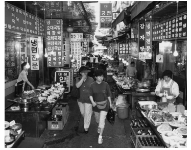
本場のキムチを味わってみては(ソウル市内の市場)