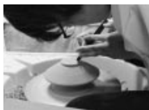
ろくろの成形の削り上げ

工芸美術学科、産業デザイン学科の卒業作品と専攻科の修了作品を展示。学生生活の集大成となる作品をぜひご覧ください。