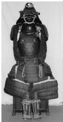
紺糸威二枚胴具足