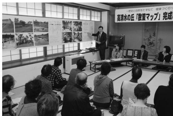
マップ作成には秋田県国保団体連合会、秋田県在宅保健師等ゆずり葉の会が協力(3月31日の完成報告会で)