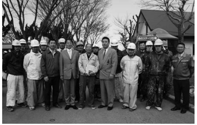
4月24日、大森山動物園で塗装ボランティアをしてくれた秋田中央塗装業組合のみなさん