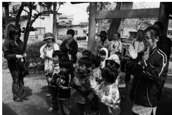
かわいい声につられて地域の人たちも一緒に散歩