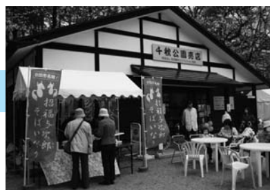
千秋公園の与次郎狐・通町招福狐の「そばいなり」は大好評でした。

4月23日、与次郎稲荷神社が榎山にもあることを知ってもらおうと、ボランティアで市内の名所などを案内している「癒しの旅サポーター」のみなさんが、地元・川口保育所のきりん組の子どもたちと一緒に、与次郎稲荷神社をはじめ、地域のお寺や神社をお参りしました。境内では小さな手を合わせ、子どもたちも興味津々の様子。あまり知られていない榎山の与次郎稲荷神社ですが、これを機会にたくさんの方が訪れてくれるといいですね！