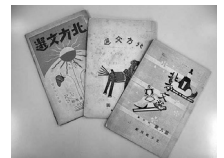
児童文集「北方文選」