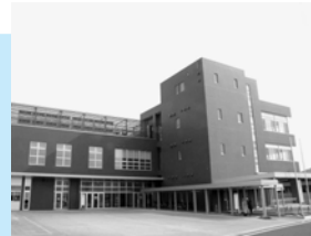
西部市民サービスセンター・ウェスター

申し込み 往復はがき(1通2人まで)に見学希望日、参加者全員の住所、氏名、年齢、電話番号を書いて、6月5日(金)(必着)まで、〒010-8560市役所市民相談室 ☎(866)2039へ。電話、ファクス、Eメールでは受け付けません。