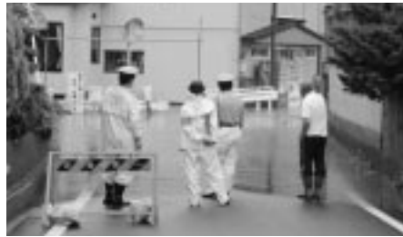
大雨による増水(7月19日、金足地区)

家具の転倒を防ぐため、転倒防止シートやL字金具などで固定しましょう。家の周りのブロック塀なども倒壊の危険がないか確認しましょう。食料は3日分、飲料水は1日1人3ℓを備えてお