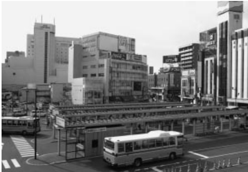
秋田杉のぬくもりがバス乗り場を訪れる人を迎えます

秋田公立美術工芸短大の学生たちが考えてくれたデザインや市民アンケートの意見を活かして設計が行われ、天井や柱の工事がスタート。使用する木材の3分の2は、秋田県木材産業協同組合連合会が寄付してくれました。また、市と(社)秋田県建築士会との共同調査をもとに耐久性の向上のための表面保護塗装などを行い、工事は3月に無事完成しました。産・学・官が連携し、力を合わせて行ったプロジェクト。その成果と取り組みが評価され、このたびの受賞となりました。