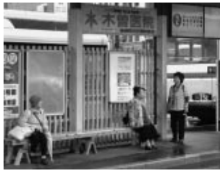
秋田杉製のベンチでゆったり

今年3月、秋田杉の部材を使って柱などをリニューアルした秋田駅西口駅前広場バス乗り場。このほど、木材利用推進中央協議会主催の平成21年度優良木造施設の表彰で、全国70施設の中から同協議会会長賞に選ばれました。