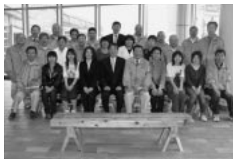
秋田市建設業協会のみなさんと、秋田公立美術工芸短大の学生たちが協力してベンチの設置作業を行いました。

バス乗り場のリニューアルについて、6月に行ったアンケートでは、「雰囲気明るくなった」など、約9割のかたから「たいへん良い」という回答をいただき、ベンチについても「乗り場と合っている」などの好意的な回答が多くありました。秋田杉を活かした街並みづくり。バス乗り場のリニューアルは、その大きく貴重なお手本になりました。