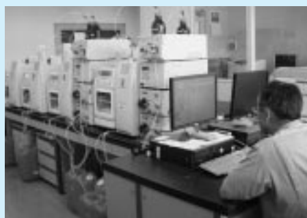
適切な検査で水道水の安全を確認しています(水質管理センター)

認定を取得すると、第三者機 関により客観的に信頼性が保証 され、市民のみなさんに、より一層安心して水道水をお使い いただけるようになります。