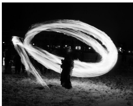
火振りかまくら(写真は仁井田)…イベント当日は千秋公園のお堀に設置する特設水上ステージで行います

申し込み ／はがきかEメール、フアクスに、住所、氏名、電話番号、お子さんの学年を書いて、企画調整課へお送りください