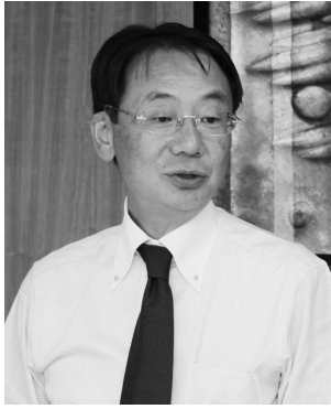
土崎VS新屋綱引き対決 調印式で(8月17日)