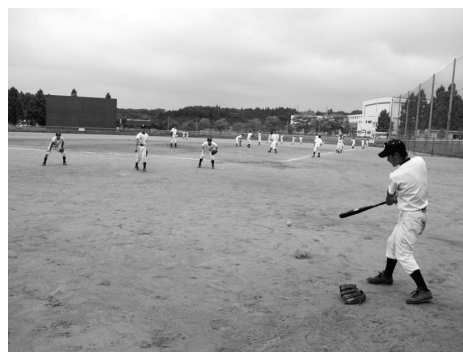
新しいチームで、来年の甲子園に向け練習開始！(明桜高校野球部)

八月というのは日本人にとって時間的にも精神的にも何かと忙しい季節です。広島・長崎の原爆、土崎空