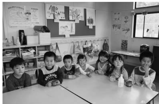
みんななかよし! (山谷幼稚園)