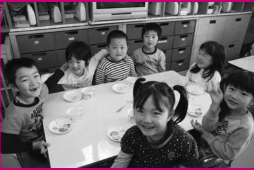
今日のおやつ、おいしかったナ(第二ルンビニ園)

来年4月から、または来年度中に、右表の認可保育所(認定こども園を除く)にお子さんの入所を希望するかの申し込みを、11月12日(木)から19日(木)まで受け付けます。