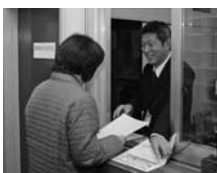
年中無休で受け付け (本庁守衛室)

婚姻・出生・死亡届などの届出は、休 みの日も本庁、土崎支所、西部市民サー ビスセンター、河辺・雄和市民センター の守衛室で受け付けます。受付時間は、 本庁、土崎支所は24時間、西部市民サー ビスセンターは8:30～21:30、河辺・ 雄和市民センターは8:30～17:15。