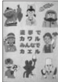
築地ありささんの作品