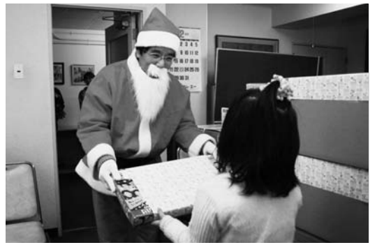
12月25日、(株)プレステージ・インターナショナルが、寺内の感恩講児童保育院を訪れ、従業員から集めたおもちゃなどをプレゼントしました

秋田プロバスケットボールクラブ(楸)を見学しました。スポーツで秋田を元気にする仕事は良いと思いました。チームと地域との交流もあったらうれしいです。bjリーグに秋田のプロバスケットチームの応援に行くのが楽しみです。