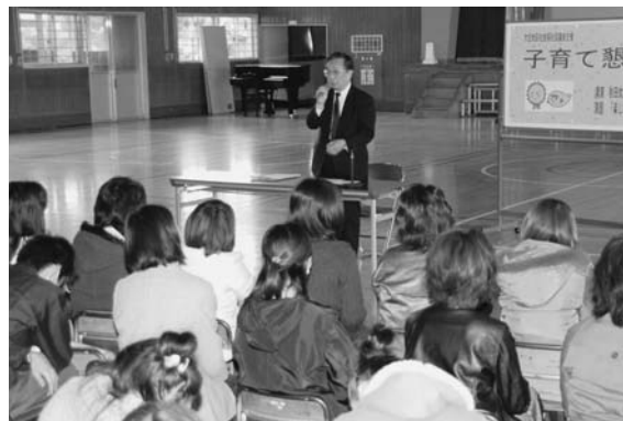
子どもの発表会の後に行われ、約50人が参加しました