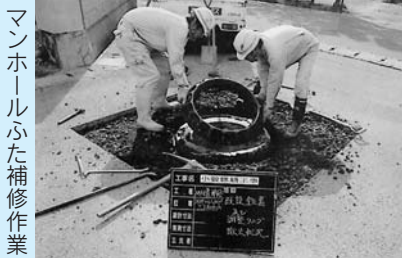
マンホールふた補修作業