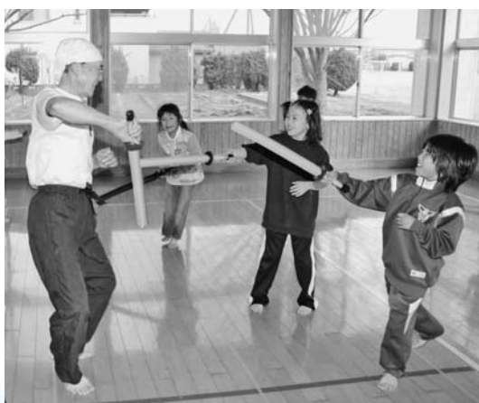
誰もがスポーツに親しむことができるように (スポーツチャンバラ教室・土崎南児童センター)

●不登校児童生徒への支援 適応指導教室「すくうる・みらい」の運営や臨床心理士による保護者相談などを行います…319万円