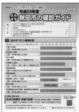
平成23年度 秋田市の健診ガイド

市では、職場などで受診の機会がない市民を対象に、がんなどの検診を実施しています(下表を参照)。検診を実施している医療機関や料金など詳しくは、「秋田市の健診ガイド」(広報あきた5月20日号と同時配布しました)をご覧ください。市保健所保健予防課へお問い合わせください。なお、健診ガイドは市役所、市保健所など市の施設、金融機関、コンビニエンスストアにも置いてあります。また、市ホームページでもご覧いただけます。