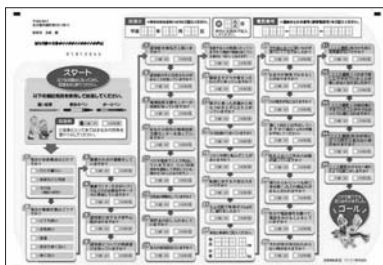
基本チェックリスト