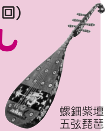
螺鈿紫檀五弦琵琶