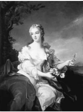
ジャン=マルク・ナティエ「花の神フローラに扮する女性」