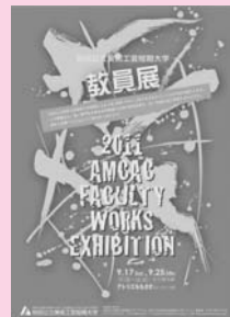
イベントの告知ポスター

映像や画像、文字などのデザイン表現を幅広く学び、商品パッケージや広告などを総合的な視野で企画・制作します。