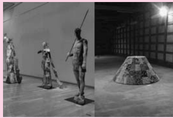
右/さまざまな素材を組み合わせた立体作品(銀閣寺の向月台をモチーフとしたもの) 左/テラコッタ(素焼き)の彫刻

地域の歴史的な文化資源(ルーツ)を調査・研究し、それらを再評価していく中で新しい芸術表現を探求します。