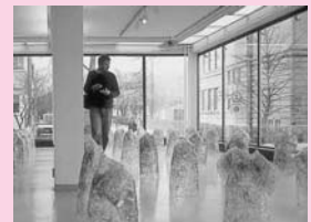
ファイバーとフィルムを使った空間芸術

さまざまな素材や媒体を使って現代美術の新しい方向性を探り、媒体にとらわれない現代的な作品を作ります。