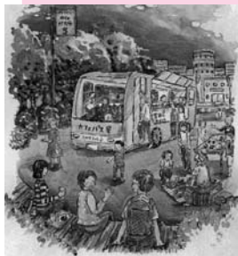
まちづくりのイメージイラスト

美しいまちなみや風景のデザインをとおして、快適さとにぎわいにあふれたまちづくりを企画・提案します。