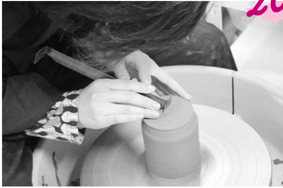
学んだすべてを作品に注ぎます(陶芸)