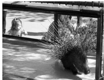
“キリンの窓”から「ご飯どうぞ」 ヤマアラシが近い“びっくり出窓”

動物園では動物たちを間近で見ることができるよう、これまでキリンやヤマアラシなどの展示方法を改良しました。今後もさまざまな工夫を凝らし、また、「まんまタイム」や「エサやり体験」などのイベントを充実させて魅力アップに努めます。