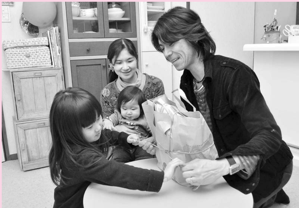
雑がみは紙ひもでキュッ!

秋田市の家庭ごみのうち、11袋に当たる約8,000トンはリサイクルできる古紙類でした(平成21年度調査)。紙をごみとして捨てるのではなく、しっかり分別して資源として生かしましょう。