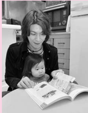
雑誌に挟んで ページの間に雑がみを挟みます。

袋状の雑がみの中に入れてしまいます。紙袋の取っ手がビニールの場合は外してください。