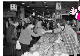
昨年10月の市場まつり

注：卸売・仲卸業者などから組織される「あきた市場マネジメント(株)」が指定管理業務を行います。