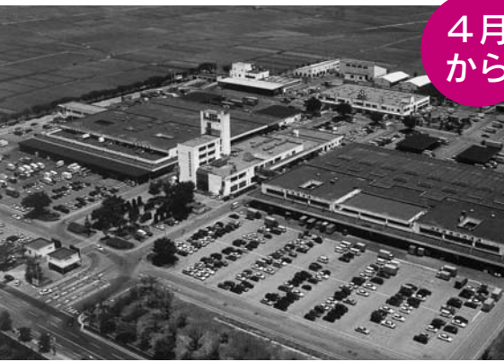
秋田市中央卸売市場 (外旭川字待合28)