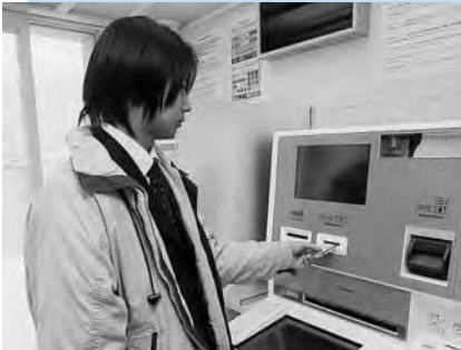
窓口より早くて100円安い!